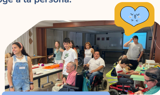
Actividades manuales con los jóvenes y los residentes del centro

Es un voluntariado de 10 días en los que se ofrece la oportunidad de aprender a eliminar barreras, prejuicios... y descubrir que la convivencia con las personas que tienen discapacidad te hace más sensible, más humano. Cada uno de ellos va dejando calar un nuevo modo de mirar, acoger, comprender y relacionarte, diferente a lo que estamos acostumbrados. La discapacidad más allá de crear barreras abre un abanico de posibilidades que experimenta quien la posee y enriquece a quien se acerca y acoge a la persona.